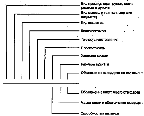
Схема условных обозначений проката с полимерным покрытием

Примечание — При отсутствии какого-либо из параметров его выбирает предприятие-изготовитель.